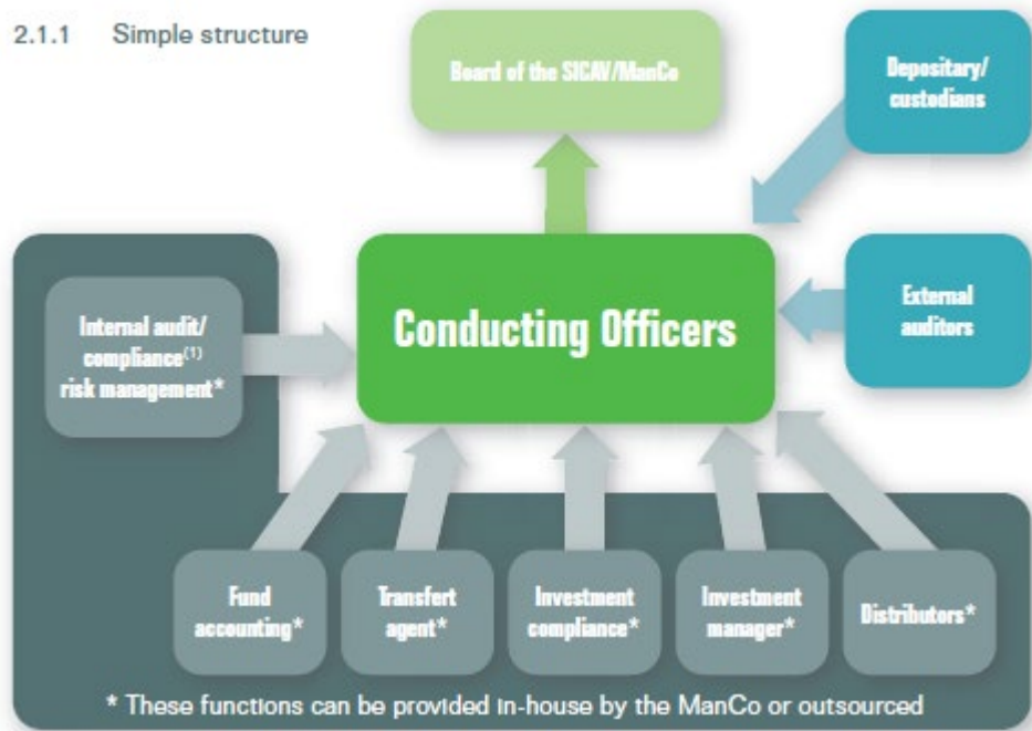
Abbildung 1: Governance-Struktur innerhalb einer Super ManCo