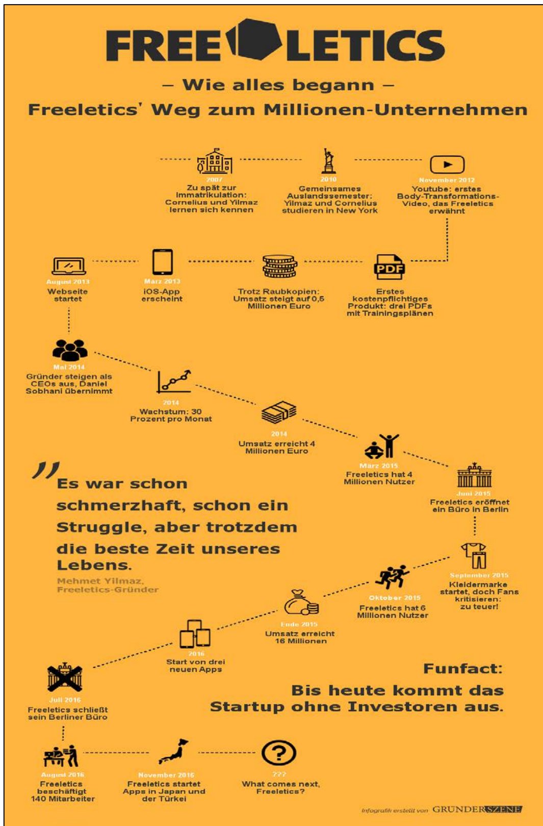
Abbildung 5: Unternehmensgeschichte Freeletics 54