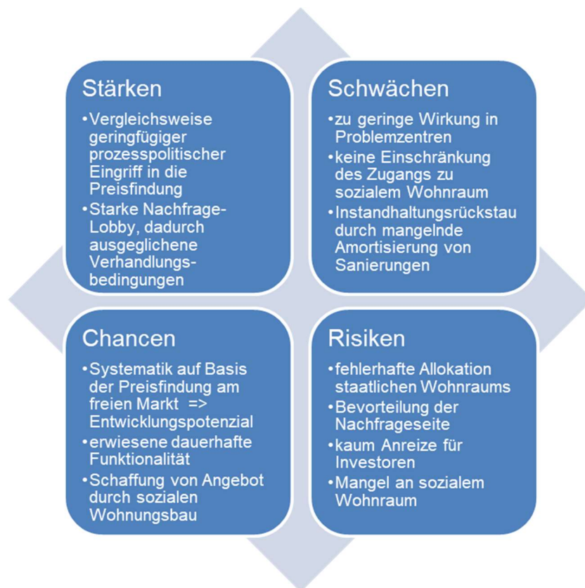
Abbildung 3 : SWOT-Analyse des schwedischen Kollektivverhandlungssystems

Die nachhaltige Wohnungsknappheit wird von den marktorientierten Parteien Schwedens kritisiert und ein freier Markt und die Abschaffung der Kollektivverhandlungen gefordert. Weiterhin die Einführung von Sozialwohnungen bzw. die Förderung eines sozialen Wohnungsbaus, der aber in Schweden derzeit faktisch nicht existiert. Dies ist folglich mit hohen Kosten für den Staat und einer großen Umstrukturierung verbunden. 68 Um dem Investitions- und Neubauhemmnis für Bauherren entgegenzuwirken wurden höhere Mieten bei Neubauten zugelassen und Mieter verpflichtet, bei Erstbezug diese anzuerkennen. In einem solchen Fall darf die Wohnung für 10 Jahre nicht als Vergleichsobjekt zur Mietbestimmung herangezogen werden und wird so in diesem Zusammenhang nicht in den Durchschnittswert der Marktmiete eingerechnet. 69