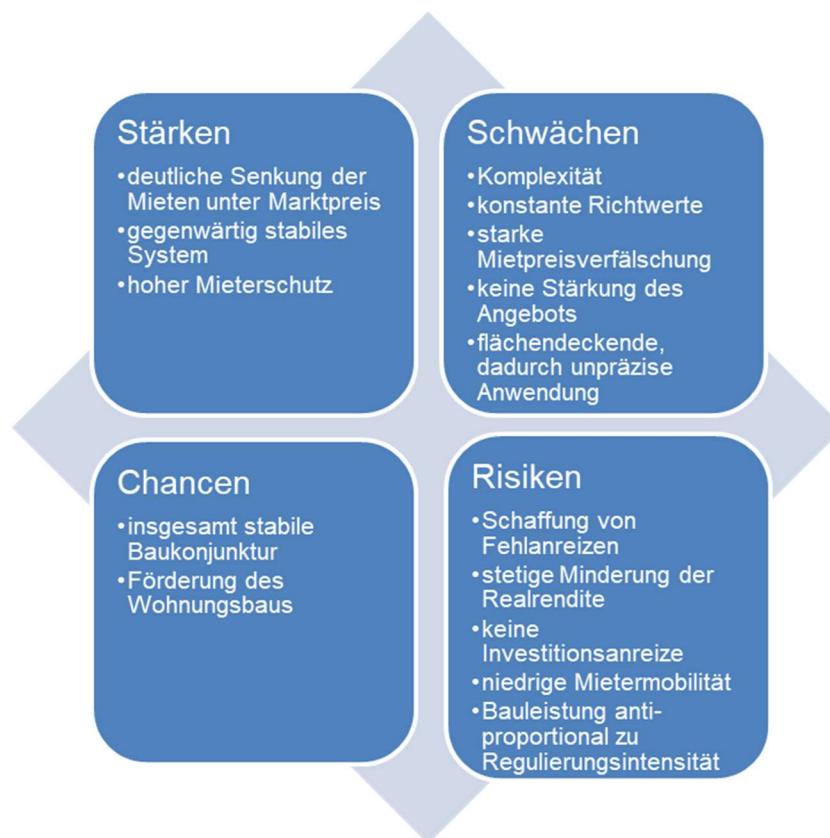
Abbildung 4 : SWOT-Analyse der im Rahmen des österreichischen Mietrechtsgesetzes ergriffenen Interventionsmaßnahmen

zurückzuführen. Privatpersonen sehen Immobilien als sicheren Anker in Krisenzeiten und investieren, teilweise ohne fundierte Renditeüberlegungen anzustellen. Die vorgenannte Studie identifiziert die Mietregulierung auch als Mitverursacher der hohen Nachfrage. Aus den künstlich niedrigen Preisen resultieren Fehlanreize, die zu einer hohen Nachfrage in zentralen Lagen führen und so die Knappheit weiter verstärken. Die Mietregulierungen führen also zu einer Kettenreaktion, da gleichzeitig das Angebot nicht ausreichend gestärkt wird und bekannte Effekte eintreten. Grafisch verdeutlicht wurde diese Kettenreaktion durch Geymüller und Christl in Form einer „Interventionsspirale“, in der die Eingriffe, Reaktionen und Auswirkungen zu einer immer weiterführenden Verschärfung der Situation führen.