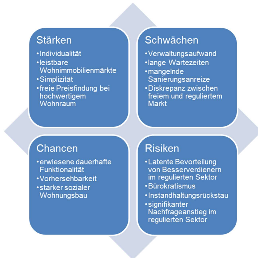
Abbildung 1 : SWOT-Analyse des Mietregulierungssystems der Niederlande

Mieter im regulierten Markt, deren Gehalt deutlich ansteigt, sind nicht gezwungen, auf die Vorteile zu verzichten und behalten oftmals langfristig ihre vergünstigte Wohnung. Dies wirkt sich angebotsmindernd aus und trägt zu der Entstehung langer Wartezeiten bei, die bei Eintritt in den Markt oft anfallen. Um diese zu überbrücken, sind Anwärter auf staatlich regulierten Wohnraum oft gezwungen, kurzlaufende und vermietetfreundliche Mietverhältnisse einzugehen. Dies geschieht beispielsweise in Form von übergangsweisen Vermietungen leerstehender Häuser über Vermittlungsagenturen, bei denen Kündigungsfristen von einem Monat die Regel sind. 38