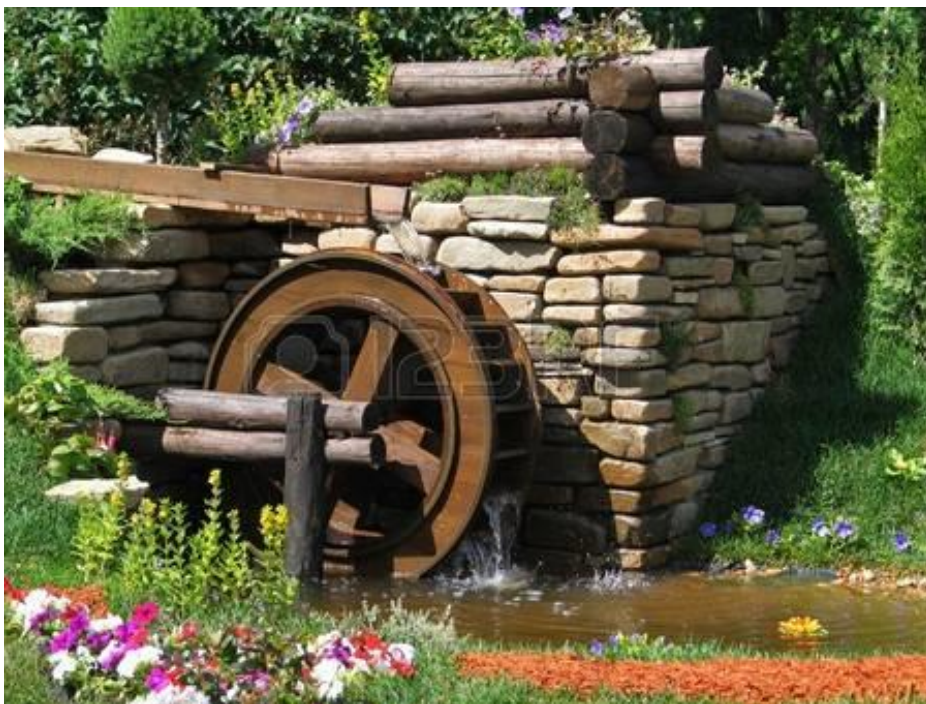
Abbildung 3: Kleine Wassermühle 31

Die wichtigste Ursache in diesem Ursachenkomplex ist vielleicht die Folgende. Europas Geografie förderte auch die politische Zersplitterung und Machtbegrenzung. Große Teile