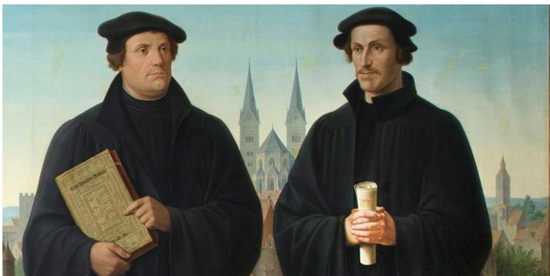
Abbildung 4: Luther und Melanchthon vor dem Augsburger Dom. 113

(47) Karl Ballenberger (1801-1860) verdanken wir ein vierteiliges Ölgemälde, das sich inzwischen im Staatsarchiv Siegmaringen befindet. Die beiden mittleren Gemälde stellen Kaiser Friedrich I. (Barbarossa) mit Gefolge sowie König Rudolf von Habsburg mit seinen Insignien dar. Auf dem linken Bild sind die Augsburger Heiligen Ulrich und Afra zu sehen, während der rechte Teil Martin Luther und Philipp Melanchthon gewidmet ist (vgl. Abbildung 4 ). Mit gutem Recht können wir unsere Reise durch die Voraussetzungen und Ursachen des Europäischen Sonderweges mit einer Betrachtung dieses Bildes beschließen.