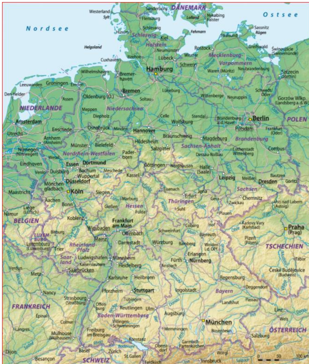
Abbildung 2: Ströme und Flüsse in Mitteleuropa 30

bau ausgeht, aber auch Großviehzucht, Transportwesen und vor allem wichtige gewerblich-industrielle Tätigkeiten einbezieht. So beinhaltet der als »Agrarrevolution« etikettierte Prozess eigentlich weit mehr als die Bezeichnung aussagt. Diese »Agrarrevolution des Frühmittelalters« stellt jedenfalls einen Schlüsselfaktor für die ganze europäische Wirtschaftsentwicklung dar. 29