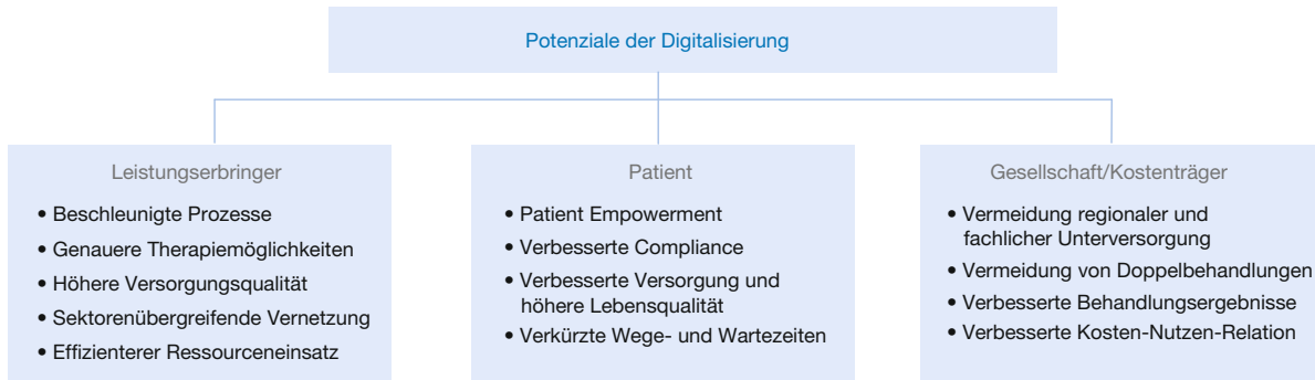
Abbildung 1 Potenziale der Digitalisierung