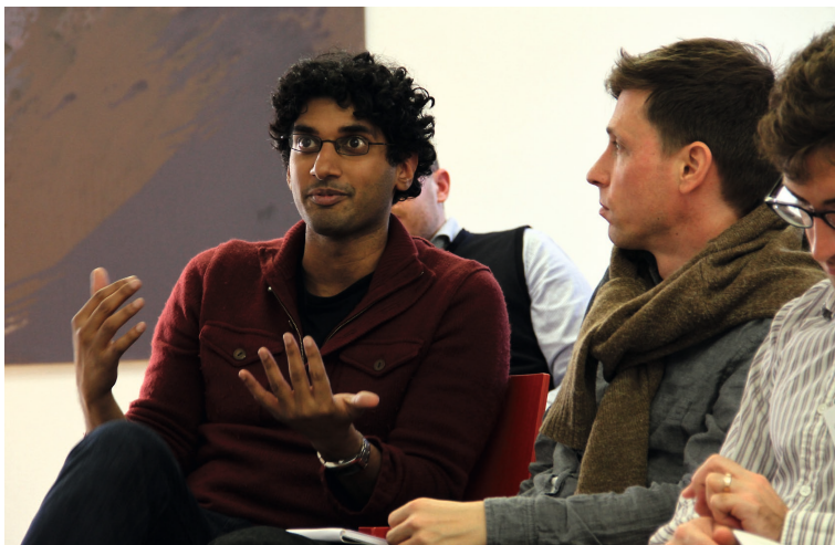
Suresh Naidu von der Columbia University in engagierter Diskussion

Zusammenfassend belegt die empirische Evidenz, dass historische Begebenheiten aus den verschiedensten geschichtlichen Epochen über unterschiedliche Kanäle Einfluss auf die spätere wirtschaftliche und soziale Entwicklung haben und sogar bis heute fortwirken können. Die – sehr selektive – Auswahl der hier präsentierten Studien zeigt die enorme Spannweite des Forschungsgebietes auf.