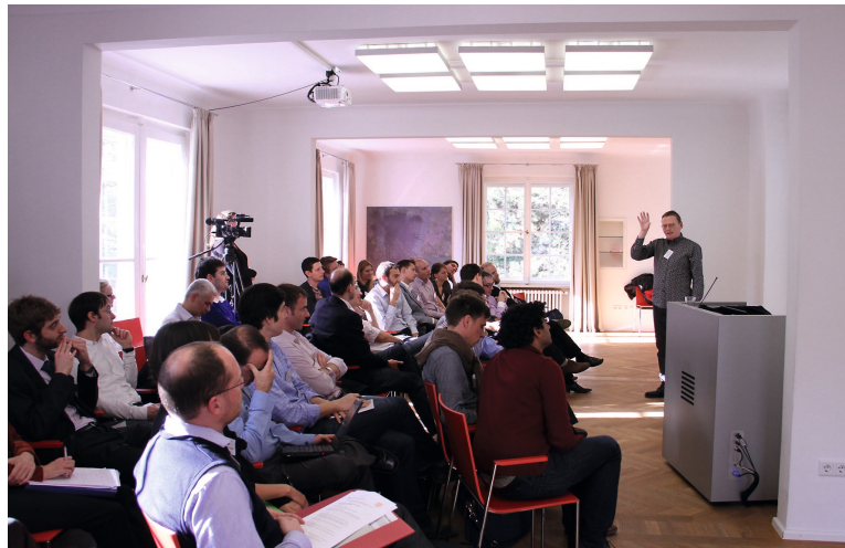
Die Teilnehmer der CAS-Konferenz folgen der Keynote Lecture von James Robinson.

Ein weiterer Forschungsaspekt ist die Wirkung von Bildung, die aufgrund der Verbreitung von Religionen entstand, auf die spätere wirtschaftliche Entwicklung. So erklären Becker und Wößmann (2009) den – im Vergleich zu Katholiken – höheren wirtschaftlichen Erfolg der Protestanten durch ihr höheres Bildungsniveau. Nach der Reformation hatte Luthers Forderung, dass jeder die Bibel lesen können sollte, zu höheren Schulbesuchsraten von protestantischen Kindern und somit zu einem Bildungsvorsprung der Protestanten geführt. Dieser Bildungsvorteil ist persistent: Becker und