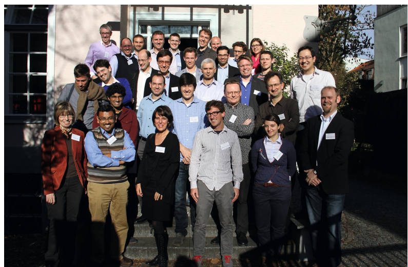
An der CAS-Konferenz nahmen nicht nur zahlreiche international renommierte Wissenschaftlerinnen und Wissenschaftler teil, sondern auch der wissenschaftliche Nachwuchs.

Das sich rasant entwickelnde Forschungsgebiet untersucht, welche längst vergangenen historischen Ereignisse Einfluss auf aktuelle wirtschaftliche Entwicklungen und die Struktur heutiger Gesellschaften haben (für ausführliche Überblicksartikel vgl. Nunn 2009; 2014 und Spolaore und Wacziarg 2013). So gehen Comin, Easterly und Gong (2010) beispielsweise der Frage nach, ob der Wohlstand der Nationen bereits 1 000 Jahre vor Christus bestimmt wurde. Den wohl längsten Schatten der Geschichte bisher belegen Ashraf und Galor (2013), wenn