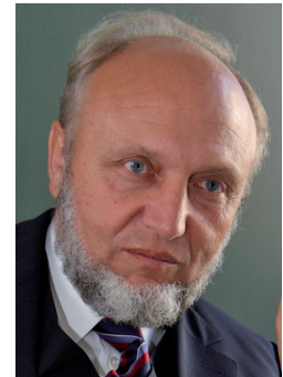
Prof. Dr. Dres. h.c. Hans-Werner Sinn, Präsident des ifo Instituts

Zuzugeben ist, dass die konjunkturellen Wachstumsprognosen nie punktgenau stimmen. Aber wie könnten sie das? Punktprognosen mit Nachkommastellen beim Wachstum sind praktisch immer falsch, wenn man darauf abstellt, ob der Punkt getroffen wird. Das gilt für alle Prognosen in allen Disziplinen, immer und überall. Deswegen veröffentlicht das