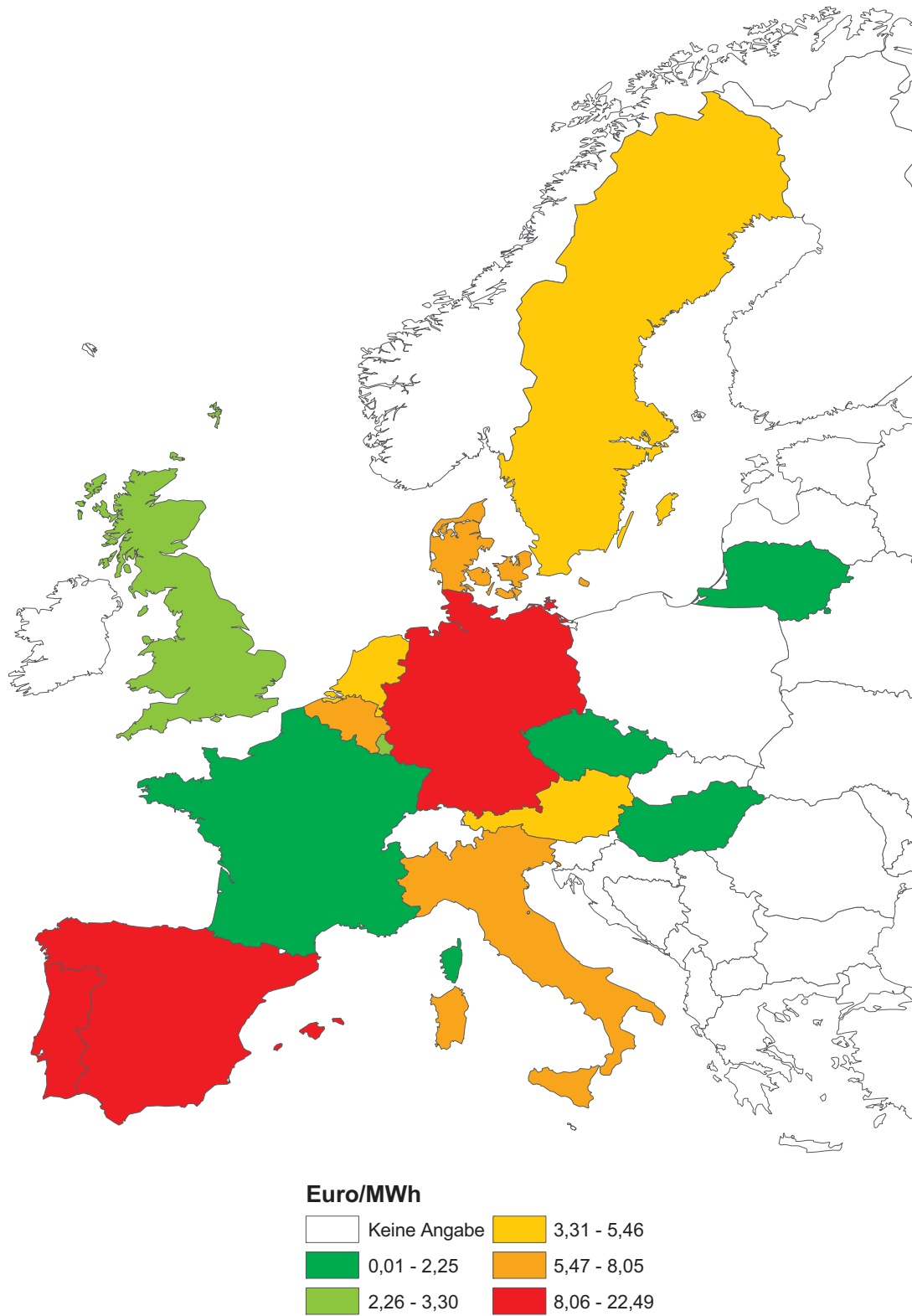
Abb. 1 Ausgaben zur Förderung erneuerbarer Energien pro verbrauchte Einheit Strom 2009