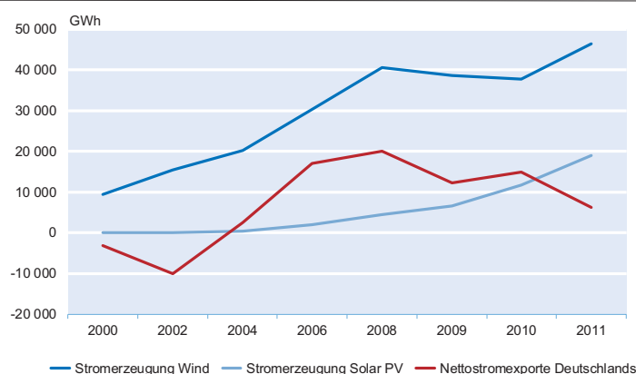
Abb. 1 Erneuerbare Energie in Deutschland und Stromhandel mit dem Ausland

Abbildung 3 bildet den gesamten Stromhandelssaldo Deutschlands ab – die Differenz der gesamten Exporte in alle Nachbarländer abzüglich der gesamten Importe. Deutlich wird hier wieder die saisonale Schwankung. Interessanterweise unterliegen die Exporte diesen Veränderungen deutlich mehr als die Importe, die ein kontinuierlicheres Muster haben. In den deutschen Stromhandelsdaten ist der Beschluss, die ältesten Kernkraftwerke Deutschlands stillzulegen, gut zu erkennen. Im Jahr 2011 sank das Stromhandelssaldo im April unter null, nachdem Mitte März das Moratorium beschlossen wurde. Nach dem Abschalten der Atomkraftwerke am 17. und 18. März (vgl. BDEW 2011) wurden die Stromzukäufe aus dem Ausland erhöht und die Lieferungen ins Ausland verringert. 1 Die Nettoexporte brachen im Jahr 2011 heftiger ein als in den Jahren zuvor und blieben länger im negativen Bereich. Auch die Jahresdaten in Abbildung 1