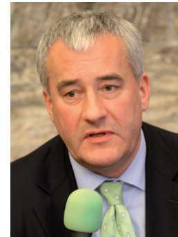
Dr. Ludwig Spaenle, MdB*

Eine zukunftsgerichtete Bildungspolitik darf daher über der Diskussion um ei-