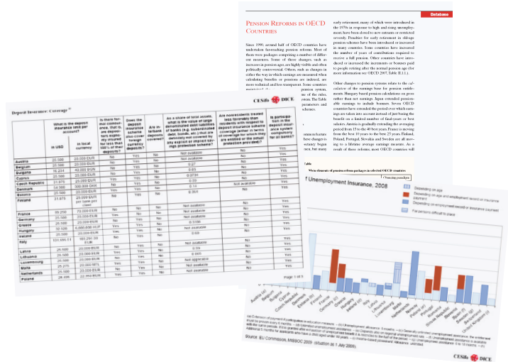
Abb. 2 Beispiele für Tabellen, Graphiken und Berichte ...