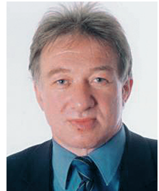
Gustav Adolf Horn*

Wie sind diese verschiedenen Vorschläge nun aus gesamtwirtschaftlicher Sicht zu beurteilen? Das Kriterium, nach dem ein Urteil in dieser Sache gefällt werden sollte, besteht dabei in den Konsequenzen, die das jeweilige Vorgehen auf längere Sicht für Wachstum und Beschäftigung hat. Eine wesentliche Rolle spielt hier die Frage, ob konjunkturelle und strukturelle öffentliche Fehlbeträge unterschiedlich in ihrer Wachstumswirkung einzuschätzen sind. Dabei ist auch die Frage der Glaubwürdigkeit bedeutsam. Unstrittig ist zumindest in der Theorie, dass konjunkturbedingte Defizite den Wachstumspfad stabilisieren. Indem der Staat Einkommen gleichsam automatisch über bestehende Leistungsgesetze z.B. durch die Zahlung von Arbeitslosengeld in Phasen konjunktureller Schwäche ausweitet, gleicht er einen Teil des privaten Einkommensverlust, der in Folge der schwächeren wirtschaftlichen Aktivität zu erwarten