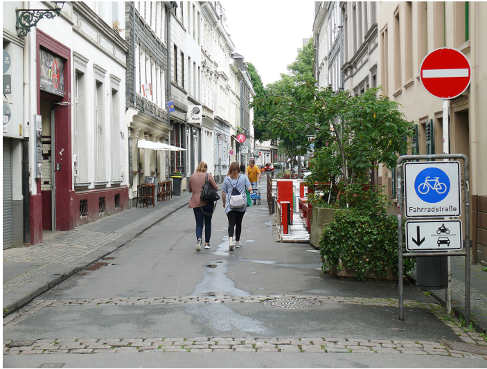
Luisenstraße in Wuppertal, Juli 2017

Damit wird die Verkehrswende Wuppertal 7 in einem Stadtteil konkret sichtbar, spürbar, erlebbar.