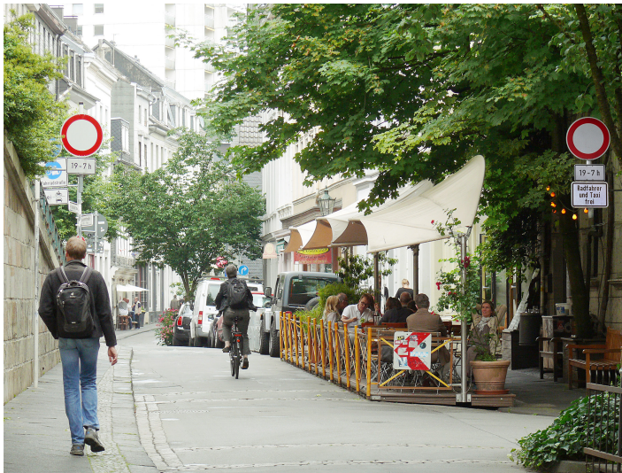
Luisenstraße in Wuppertal, Juli 2017

Für die Anwohnerschaft ist es möglich, weiterhin ein Auto zu besitzen und damit ins Stadtviertel zu kommen. Aber es werden Anreize gesetzt, damit dies für weniger Menschen attraktiv ist: Geparkt werden kann nicht mehr direkt vor der eigenen Haustür, sondern nur noch in Quartiersparkplätzen und –garagen. Hierfür werden deutlich höhere, kostendeckende Gebühren fällig. Das macht den Autobesitz – bei gleichzeitiger Verbesserung der Erreichbarkeit mit dem Umweltverbund – deutlich weniger attraktiv.