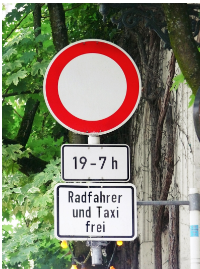
Luisenstraße in Wuppertal, Juli 2017

Für die Anwohnerschaft ist es möglich, weiterhin ein Auto zu besitzen und damit ins Stadtviertel zu kommen. Aber es werden Anreize gesetzt, damit dies für weniger Menschen attraktiv ist: Geparkt werden kann nicht mehr direkt vor der eigenen Haustür, sondern nur noch in Quartiersparkplätzen und –garagen. Hierfür werden deutlich höhere, kostendeckende Gebühren fällig. Das macht den Autobesitz – bei gleichzeitiger Verbesserung der Erreichbarkeit mit dem Umweltverbund – deutlich weniger attraktiv.