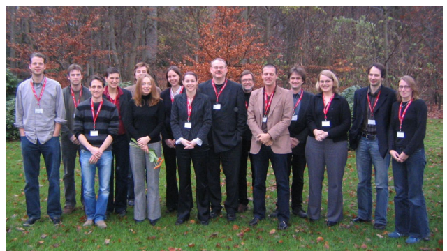
Ph.D. students and Senior Researchers attending the First International SOEP Young Scholars Symposium enjoyed the fruitful discussions.

The Graduate School of the Social Sciences of the University of Bremen and the Hanse Wissenschaftskolleg in collaboration with the SOEP department co-hosted the First International German