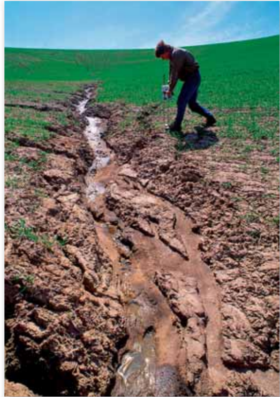
Abb. 2: Verlust von Boden durch Erosion.

Bei der Konzentration auf die Stromversorgung wird zumeist die Nutzung fossiler Brennstoffe für Heiz- und Prozesswärme, Mobilität oder auch die Herstellung von Mineraldünger und Kunststoffen vergessen. Schließlich besteht die energetische Grundlage unserer Gesellschaft aus weit mehr als nur Elektrizität. Beispielsweise hängt unsere gesamte Landwirtschaft und Nahrungsmittelversorgung an Öl und Gas. In einer Lebensmittelkalorie stecken zehn Kalorien fossiler Energieträger an Dünger und Transport (PIMENTEL/HENRY 1994). Wir planen Energiepflanzen für die Nutzung von Biomassekraftwerken als Regelenergie sowie für Güter- und Schiffsverkehr ein (FVEE 2010), müssen sie