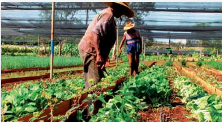
Abb. 3: Voices of Transition , Mitglieder Cooperativa Alamar.

Die Art und Weise, wie Bürgerenergiegenossenschaften die Energiewende vorantreiben, zeigt hierfür schon einige wichtige Punkte. Wenn ich Windräder vor Augen habe, die meine Lebensweise ermöglichen, kann dies zu einem Nachdenken über das Thema Energieverbrauch führen, auch wenn ich einen großen Teil der Energie nicht über Strom- und Gasanschluss beziehe, sondern in Einkaufsstüben ins Haus trage. Der Krisenbedrohung und -rhetorik mit lokalen, dezentralen und partizipativen Veränderungen durch bürgerschaftliches Engagement zu begegnen (HEINRICHS 2013), ist ein Konzept, das Bürgerenergiegenossenschaften oder Transition Towns gemein haben. Die Vision der regional produzierten und konsumierten Tomate lässt sich verlockend einfach auf den regional produzierten Strom übertragen. Energieautarkie, Unabhängigkeit von großen Energieversorgern und Dezentralität sind wichtige Leitbilder der Diskussion – wobei nicht vergessen werden sollte, dass das Europäische Verbundnetz von Portugal bis Skandinavien auch weiterhin im Gleichtakt schwingen und geregelt werden muss um zu ermöglichen, dass bei Flaute beispielsweise portugiesischer Sonnenstrom genutzt werden kann (HEIDE et al. 2011).