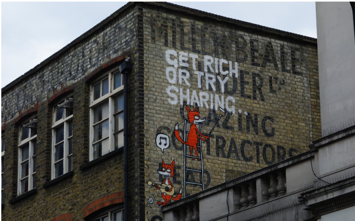
Abb. 2 Graffiti in London zum Thema „Sharing“

Alternativer Konsum kann als Erwerb von Waren jenseits formaler Verkaufsstellen verstanden werden (Williams/Paddock 2003: 312). „Teilen“, „Austauschen“ und „Verleihen“ stellen dabei besondere Formen des alternativen Konsums dar (Frick/Hauser/Gürtler 2013: 6 f.). Teilen gehört zum menschlichen Charakter und ist eine natürliche Art und Weise des sozialen Austausches. Der Begriff „Austausch“ impliziert jedoch bereits eine wirtschaftliche Komponente. Frick/Hauser/Gürtler (2013: 11) unterscheiden verschiedene Praktiken des „Teilens“, die auch auf Fahrradverleihsysteme übertragen werden können. „Mothering“ meint teilen ohne Bedingung, zum Beispiel zwischen Mutter und Kind. „Socialising“ ist eine Praxis des „Teilens“ mit dem Ziel, menschliche Interaktion und Beziehungen zu stärken, beispielsweise durch die gemeinsame Nutzung von Fahrrädern in Privatbesitz, die mit Fremden geteilt werden. „Gifting“ (Schenken) stellt eine besondere Form des „Teilens“ dar, zum Beispiel die Bereitstellung von 30 kostenlosen Minuten für Nutzer von Fahrradverleihsystemen. Da jedoch eine Nutzergebühr gezahlt wird, beschreibt „Exchanging“ die Praxis in Bezug auf Fahrradverleihsysteme am besten.