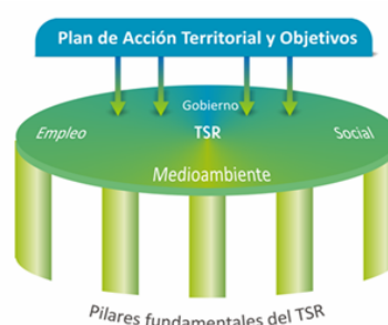
Ilustración 2- Principios del Protocolo TSR 19

El protocolo identifica las Áreas y Sub-áreas de Impacto, las mismas se exponen en la Ilustración 3, que enumera aquellos ámbitos de actuación sobre los que el territorio tiene un impacto di recto o indirecto.