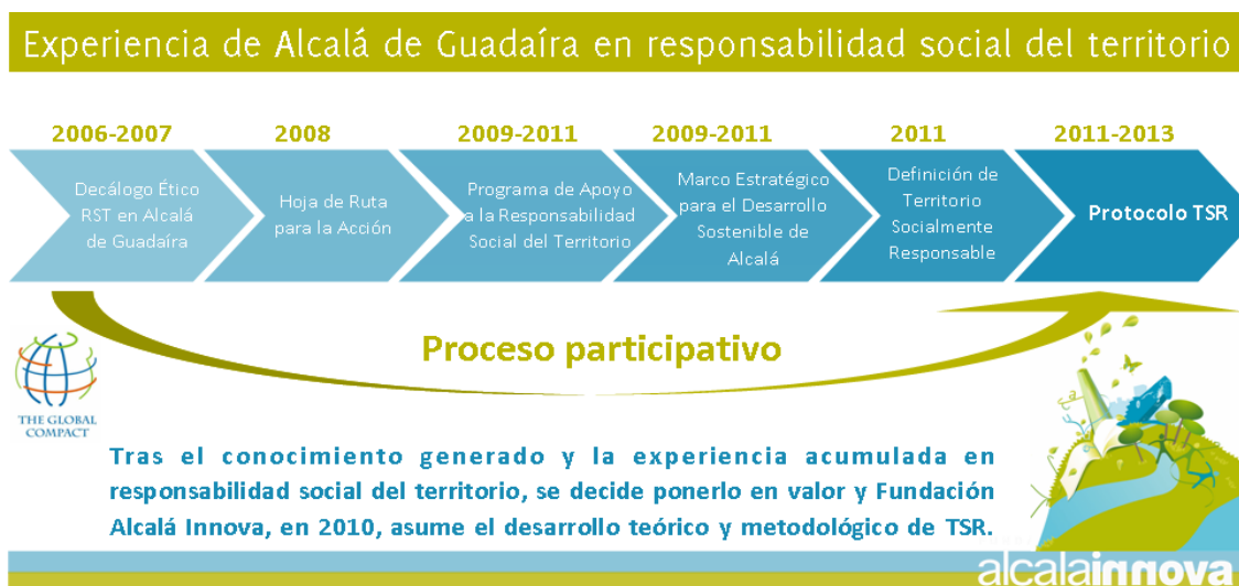
Ilustración 1- experiencia de RST en Alcalá de Guadaíra 16

Concebida inicialmente como un proceso de diálogo abierto entre los actores Socioeconómicos más representativos de la ciudad en torno al tema de la Responsabilidad Social, el punto de partida de su desarrollo teórico y metodológico fueron los diez principios de Global Compact en un intento de adaptarlos a la realidad social, económica y medioambiental de la ciudad (periodo 2006-2007 de la Ilustración 1).