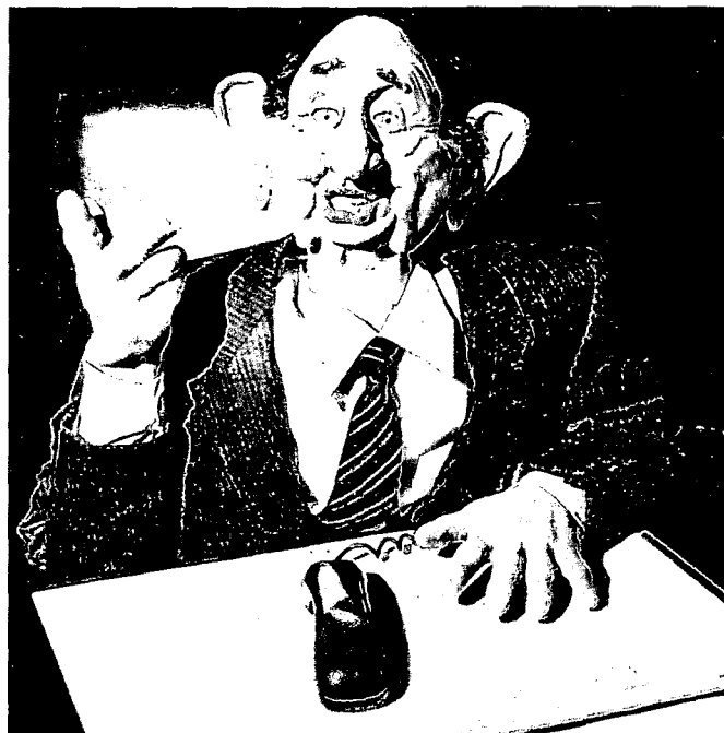
Satire-Opfer Genscher: Enormes Mitteilungsbedürfnis

sich über die Ergebnisse einer Konferenz in Damaskus zu informieren.