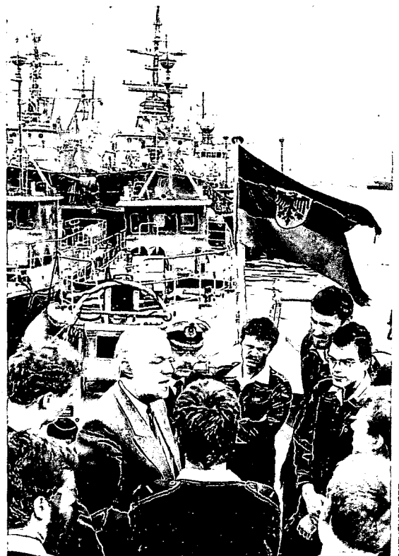
Hardthöhe-Chef Stoltenberg: Großbestellungen verhindern geforderte Einsparungen

Und der Abwärtstrend des Bundeswehretats geht weiter. Die Finanzplanung bis 1994 sieht eine jährliche Kürzung um 1,5 Milliarden Mark vor. Das bedeutet für die Vierjahresperiode eine Reduzierung etwa der Personalausgaben um 9,7 Prozent. Doch die Bundeswehr hat durch das NVA-Erbe im Moment