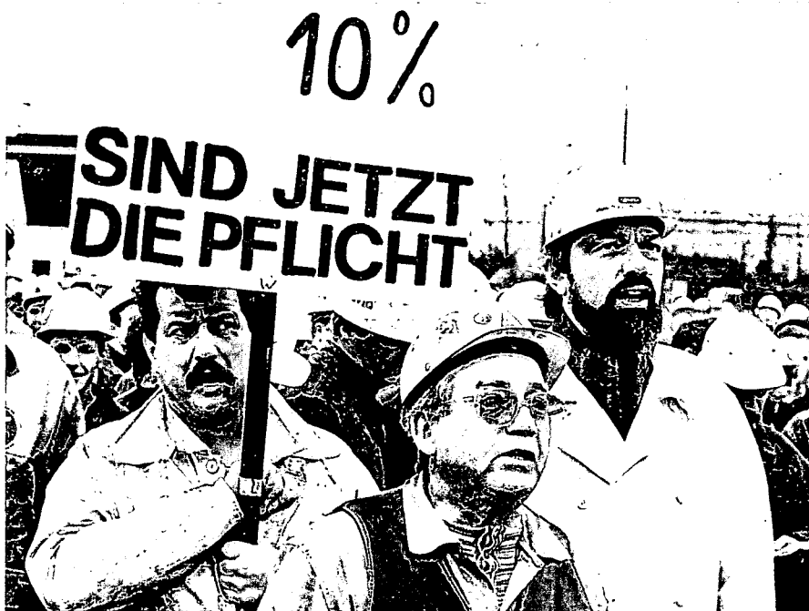
Metallarbeiter: Kollision zwischen Geld- und Tarifpolitik