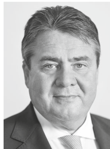
Sigmar Gabriel ist Bundesminister für Wirtschaft und Energie.

Die Digitalisierung stellt unser industriell geprägtes Wirtschaftsmodell auf den Prüfstand. Wenn auch in Zukunft die besten Fahrzeugbauer und Fabrikaurüster der Welt in Deutschland und nicht in Kalifornien sitzen sollen, müssen wir dem Übergang zu Industrie 4.0 meistern. Nur mit einer modernen Industriepolitik, die gerade dem Mittelstand Orientierung in der digitalen Transformation gibt, werden wir uns im internationalen Wettbewerb behaupten.