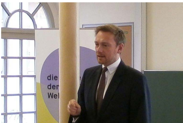
Beim Eröffnungsvortrag: Christian Lindner, Bundesvorsitzender der FDP und Vorsitzender der FDP-Fraktion im Landtag NRW.

Als Eröffnungsvortrag erörterte Christian Lindner , Bundesvorsitzender der FDP und Vorsitzender der FDP-Fraktion im Landtag NRW (Foto), unter dem Titel: „Mehr Unternehmertum in Deutschland – Was die Politik tun sollte“ die wirtschaftspolitische Dimension des Tagungsthemas.