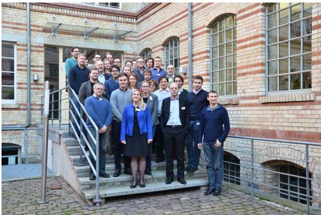
Die Teilnehmerinnen und Teilnehmer des Workshops.

Am 7. und 8. Dezember 2015 fand am Leibniz-Institut für Wirtschaftsforschung Halle (IWH) zum 16. Mal der IWH-CIREQ Macroeconometric Workshop statt. Die in Kooperation mit dem Centre interuniversitaire de recherche en économie quantitative (CIREQ), Montréal, durchgeführte Veranstaltung beschäftigte sich dieses Mal mit zentralen Herausforderungen, denen sich die ökonomische Prognose zu stellen hat: Strukturbrüche in den Daten, statistische Revisionen und Fehler bei der Messung wichtiger Indikatoren. 1