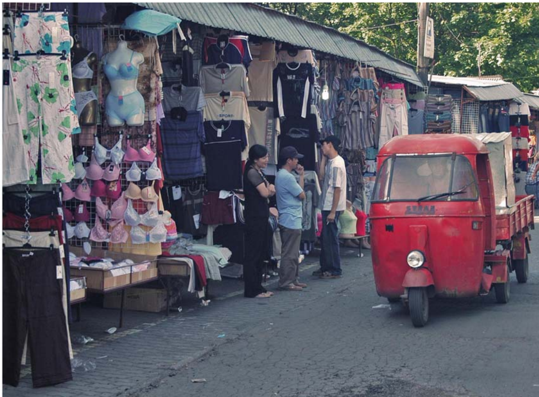
Fot. Błażej Sendzielski