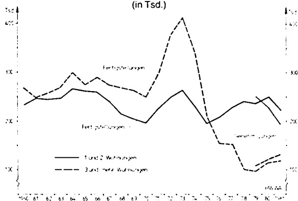
Abbildung 2 Fertigstellungen und Genehmigungen im Wohnungsbau (in Tsd.)