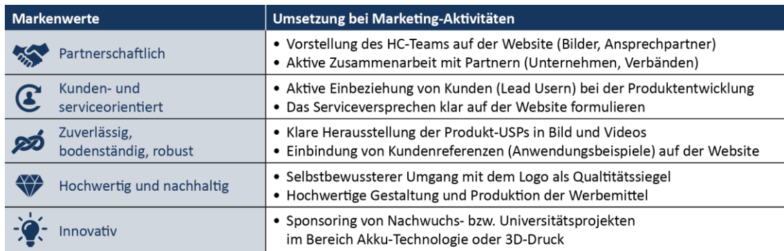
Abbildung 3: Marketing-Aktivitäten zur Umsetzung der Markenwerte

Für Holger Clasen können verschiedene erste Maßnahmen identifiziert werden. Beispielsweise könnte ein Sponsoring/Wissenschaftskooperationen umgesetzt werden, d.h. eine Unterstützung von Forschungsprojekten an Universitäten in den Bereichen Akutechnologie, Automatisierung und 3D Druck (siehe Abbildung 3). Dies wäre ein Instrument, das die technische Innovationsfähigkeit der Produkte befördert und zudem mittel- bis langfristig auch imagewirksam auf dieser Facette sein sollte. Alternativ könnte die Entwicklung von Testimonials ein Ansatzpunkt sein: Mitarbeiter führender Unternehmen in den Kernbranchen von Holger Clasen erklären, wie die Werkzeuge der Marke Holger Clasen durch ihre Zuverlässigkeit und Hochwertigkeit den Arbeitsalltag erleichtern und/oder wie sie die Partnerschaft wahrgenommen haben. Dies kann heutzutage kosteneffizient über das Onlineumfeld abgebildet werden und ermöglicht eine sehr zielführende Kommunikation der relevanten Markenattribute.