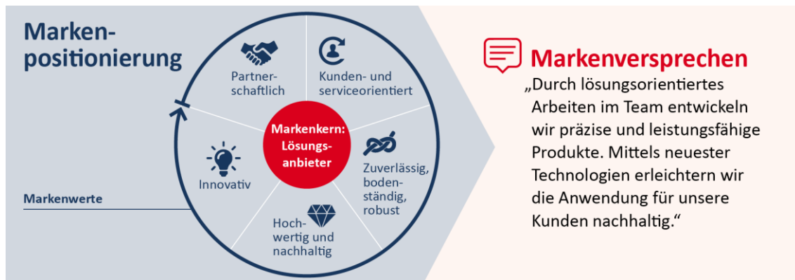
Abbildung 2: Markenpositionierung von Holger Clasen

Holger Clasen nutzt aktuell eine klassische Dachmarkenstrategie, bei der sämtliche Leistungen und Produkte des Unternehmens unter einer Marke vertrieben werden. Der große Vorteil hierbei ist, dass das Unternehmen seiner gesamten (großen) Produktpalette ein klares Erscheinungsbild gibt und alle Produkte unter dieser Marke, von der etablierten Markenwirkung gleichermaßen profitieren. Die Verwendung einer Dachmarke schränkt aber andererseits auch die spezifische Positionierung von bestimmten Produkten in bestimmten Märkten ganz klar ein. Die Positionierung muss also für die gesamte Produktpalette passend sein: Hier ist die Fokussierung auf den Markenkern