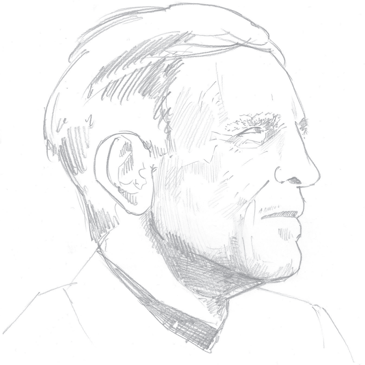
Wilhelm Röpke (10. Oktober 1899 – 12. Februar 1966)