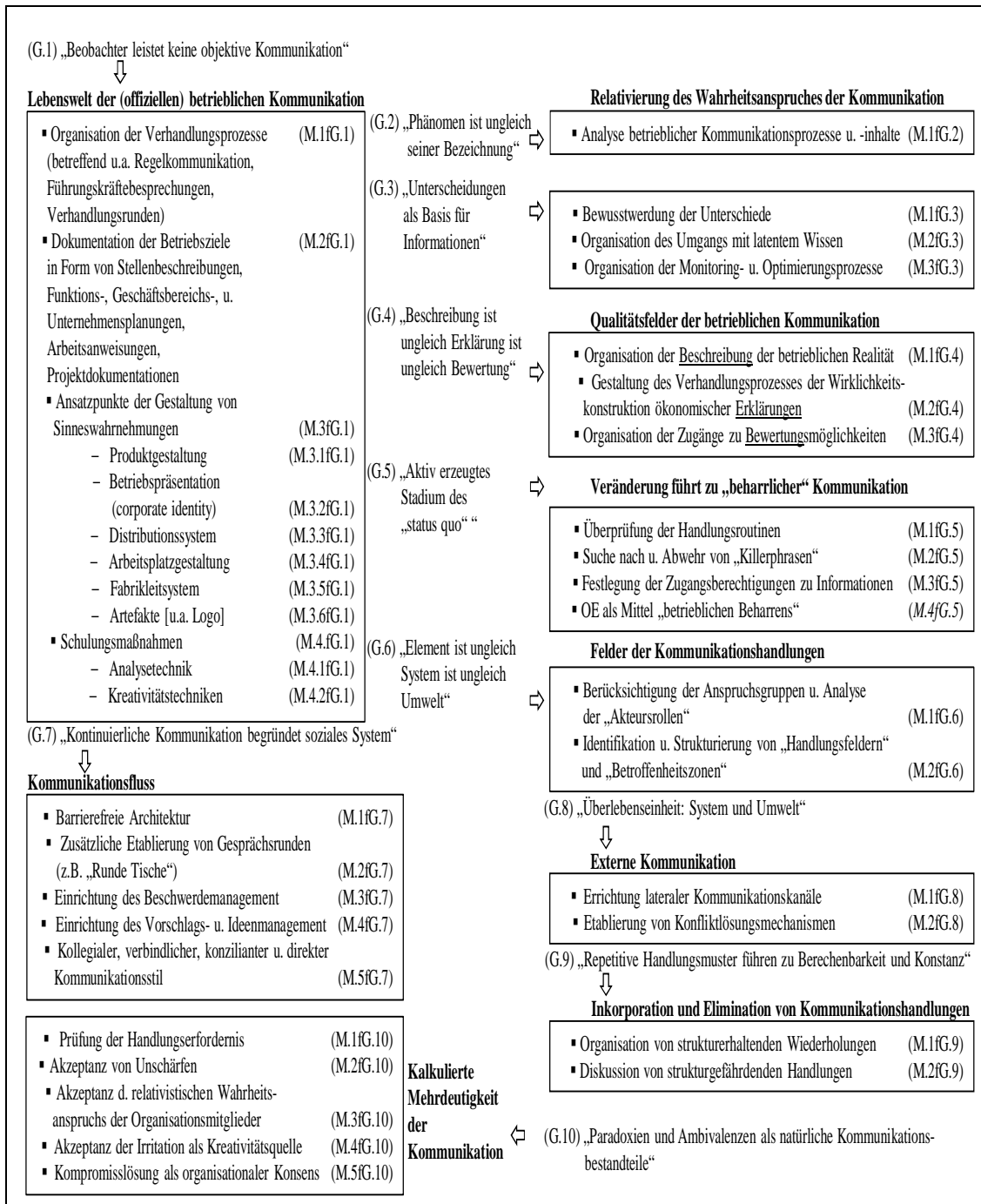
Abb.4: Gestaltungsaufgaben betrieblicher Kommunikation im systemischen Kontext