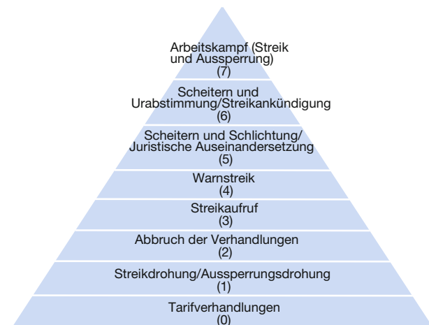
Abbildung 1 Die Eskalationspyramide