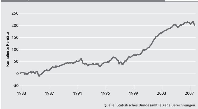
Abbildung 1: Kumulierte Rendite von Carry Trades im Zeitverlauf

Bemerkung: Die Grafik zeigt die kumulierte Rendite der Carry Trade Strategie im Zeitverlauf.