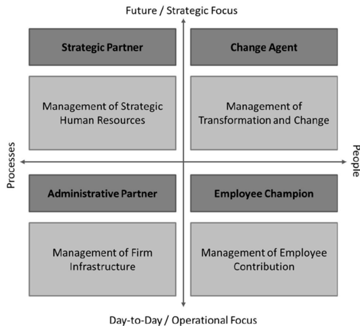
Abbildung 1: Business Partner Modell in Anlehnung an Ulrich 2013, S. 24

der Bildung führen können. Es entstehen sogenannte pädagogisch-ökonomisch Differenzen, die vom Bildungsmanager ausbalanciert werden sollten (Hasanbegovic, 2010, S. 139f.).