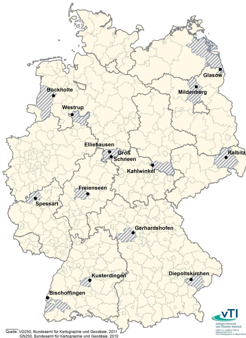
Abbildung 2: Die Lage der Untersuchungsdörfer

Anmerkung: In der Karte namentlich erwähnt sind die ursprünglichen Untersuchungsdörfer. In der Auflage 2012-2014 der Untersuchung ländlicher Lebensverhältnisse im Wandel wurden die Untersuchungsorte teilweise neu gefasst. Dies gilt für folgende Orte: Diepoltskirchen (neu: Gemeinde Falkenberg), Kahlwinkel (neu: Gemeinde Finne-land), Mildenberg (neu: Zehdenicker Ortsteile), Ralbitz (neu: Gemeinde Ralbitz-Rosenthal), Glasow (neu: Gemeinden Glasow und Krackow).