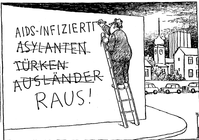
SZ-Zeichnung: P. Leger