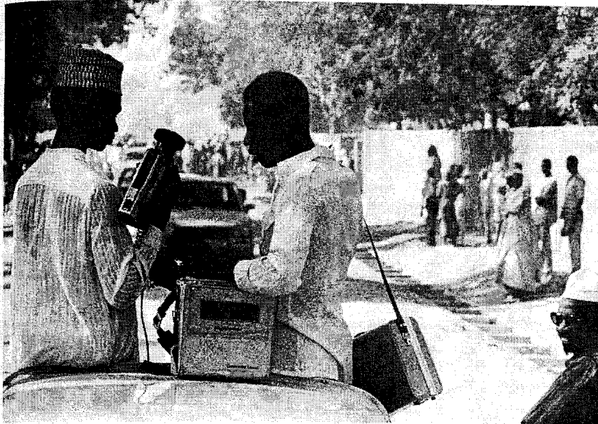
Video-Kameras im Tschad – hier allerdings nicht als Unterhaltungsmedium eingesetzt, sondern zur Kontrolle von anti-libyschen Demonstranten.

des deutsch-sowjetischen Krieges sogar im Inlandsnachrichtendienst des Deutschlandsenders eine Geisterstimme von Radio Moskau auf, die in Sprechpausen Zwischenrufe wie »Lügen, Lügen«, »Glaubt es nicht« einflocht.