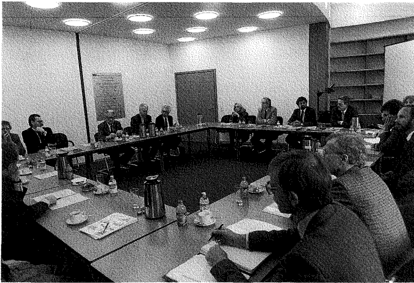
Besuch des SPD-Vorsitzenden Hans-Jochen Vogel, 10. Oktober 1988