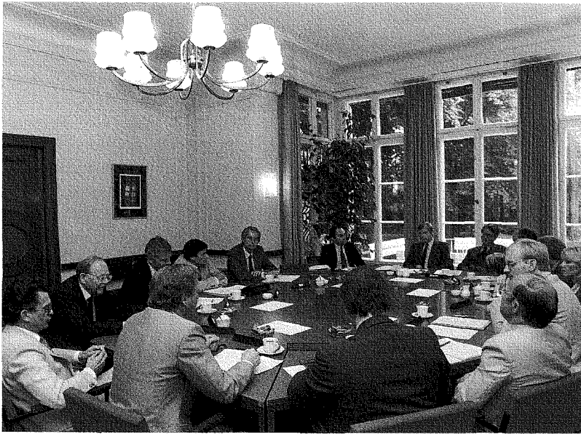
Besuch des Berliner Regierenden Bürgermeisters Eberhard Diepgen (16. Juli 1984)

Die WZB-Forschung mußte sich damit von Anfang an in einem vielschichtigen Feld kreativer Spannungen bewegen. Der in mehrere Richtungen formulierte Anspruch an die Forschung führte zu einer Kumulation von Erwartungen, die oft in divergierende Richtungen wiesen und die dadurch das wieder auseinanderzureißen drohten, was am WZB gerade vereint gehalten werden sollte.