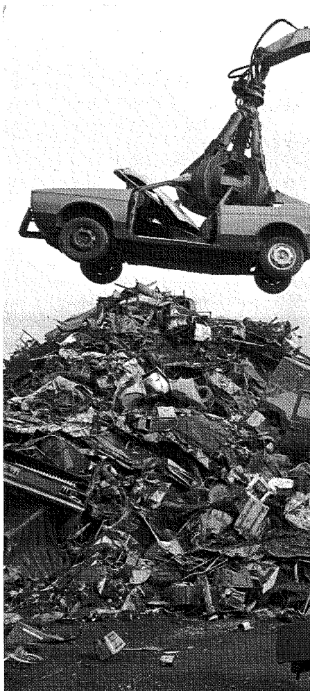
Die Folgen des Produkts bedenken. Autos auf der Schrotthalde.