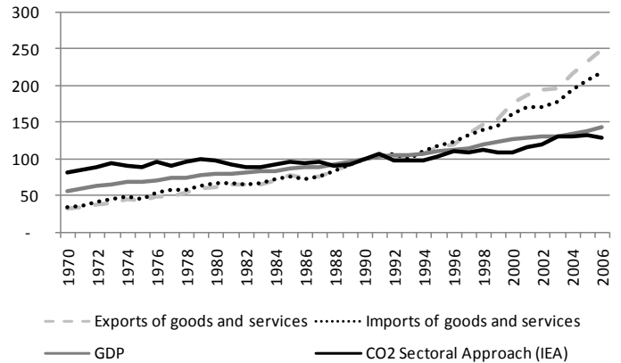
Abbildung 1: CO 2 Emissionsentwicklung Österreich (produktionsortbasiert) und Indikatoren der wirtschaftlichen Entwicklung (Index 1990=100) ursprüngliche monetäre Werte in 1990 US$