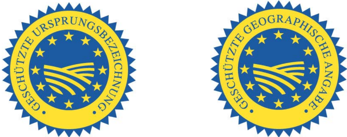
Abbildung 3: Zeichen der Europäischen Union