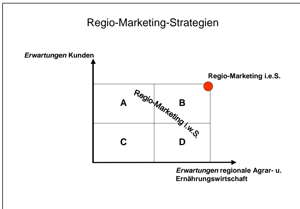
Abbildung 2: Klassifizierungsrahmen des Regio-Marketing