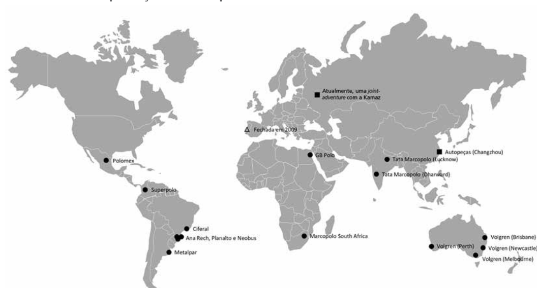
MAPA 2 Unidades de produção da Marcopolo

Como resultado, a Marcopolo controla atualmente dezessete unidades de produção no exterior e quatro plantas no Brasil (Marcopolo Ana Rech, Marcopolo Planalto, Ciferal e Neobus), 17 conforme apresentado no mapa 2.