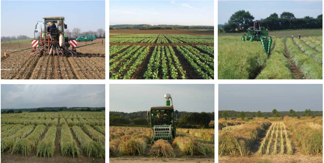
Kerndruschparzellen für Rapsversuche