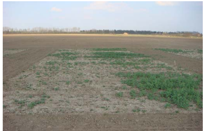
Trockenes Frühjahr (nach Winterschaden)