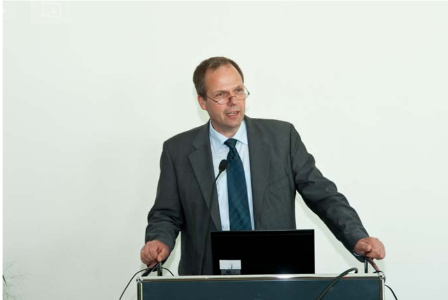
(Präsident W. Schwarz)