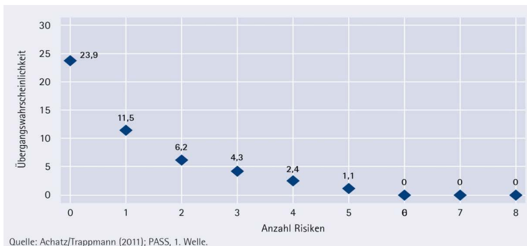
Abbildung 3: Übergangswahrscheinlichkeit nach Anzahl der Risikomerkmale (in Prozent)