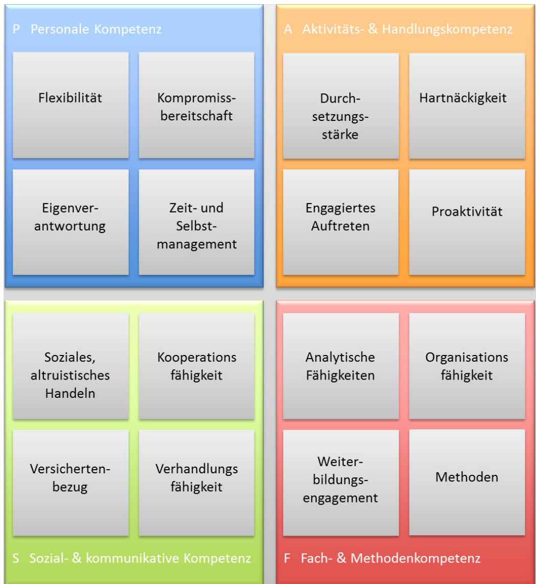
Abbildung 1: Kompetenzmodell nach Erpenbeck und Rosenstiel 43

Personale Kompetenzen werden als „die Dispositionen einer Person, reflexiv selbstorganisiert zu handeln“ 44 definiert. Als Beispiele hierfür werden Selbstreflexionsfähigkeit, Selbstmanagement, Eigenverantwortung und Selbstvertrauen angeführt. 45 Als weitere Kompetenzklasse werden die Aktivitäts- und umsetzungsorientierten Kompetenzen beschrieben, welche dadurch zum Ausdruck kommen, dass Personen aktiv und selbstorganisiert handeln und dieses Handeln auf „die Umsetzung von Absichten, Vorhaben und Plänen“ 46 ausrichten. Beispiele hierfür sind Initiative, Proaktivität,