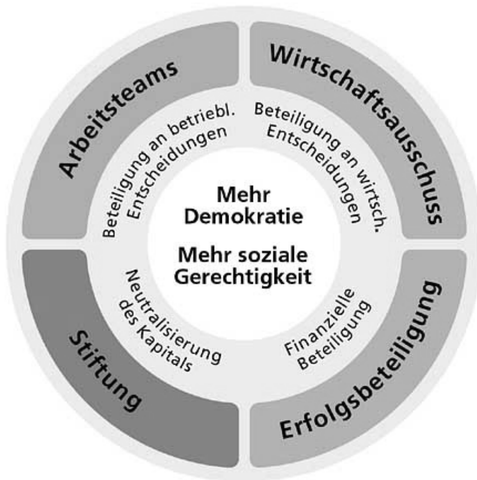
Abb. 2: Das Hoppmann-Mitbestimmungsmodell