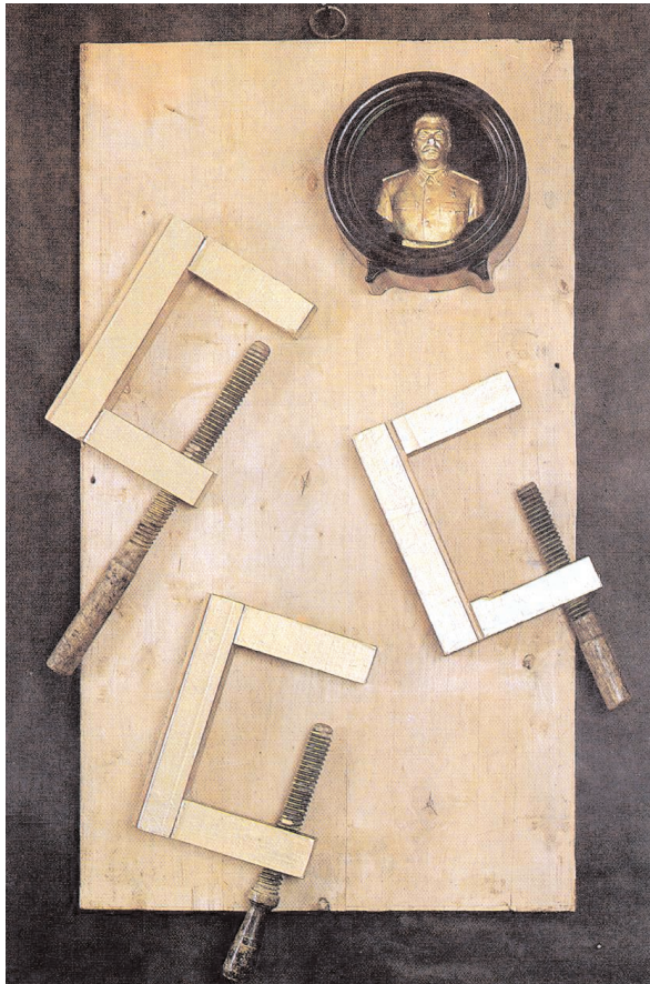
Vadim Voinov: »Initsial« [Die Initiale], 1991, aus: Most cherez Styks. Funktsiokollazhi Vadima Voinova [Die Brücke über Styx. Funktional-Collagen Vadim Voinovs], St. Petersburg 1994

Es steht dennoch außer Zweifel, dass der Terror unter Jossif Stalin eine eigene Qualität annahm – nicht nur im Ausmaß, sondern vor allem durch seine Verselbständigung gegenüber jedem rechtsphilosophisch noch so zweifelhaften Rationalitätsmotiv. In dieser Zeit wuchsen die einzelnen, in den verschneiten Weiten Sibiriens sowie des europäisch-russischen „hohen Nordens“ versprengten Lager zu einem ganzen „Archipel“ zusammen, der – um noch mal Solschenizyns Metapher aufzugreifen – aus „unzähligen kleineren und großen Inseln“ bestand. Schon zu Lenins Zeiten reichte oft eine haltlose Denunziation bei der „Tscheka“, der „Außerordentlichen Kommission zur Bekämpfung von Konterrevolution und Sabotage“, um als „Volksfeind“ verhaftet und nach einem Schnellverfahren entweder hingerichtet oder in eines der Lager verschleppt zu werden. Aber in der Epoche der „Schauprozesse“, die 1928 mit der Verurteilung „rechten Abweichler“ innerhalb der WKP (B) und