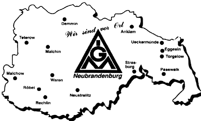
Aus einer Broschüre der IG Metall Neubrandenburg

In Verwaltungsstellen der IG Metall haben sich mittlerweile eine Vielzahl von Aktivitäten dieser Richtung entwickelt. Die vorliegende Studie untersucht am Beispiel einiger ausgewählter Verwaltungsstellen, die über entsprechende Modellprojekte verfügen, Art, Zielsetzung und Wirkungsweise dieser Projekte. Zentrale Fragestellung bei der Untersuchung der Modellprojekte war, welchen Beitrag die bisher erprobten überbetrieblichen ehrenamtlichen Strukturen zur Entwicklung gewerkschaftlicher Präsenz in kleinen, bisher unerreichten Betrieben haben können.