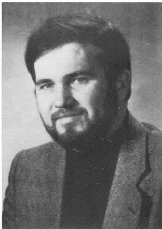
Prof. Dr. Jürgen Kocka