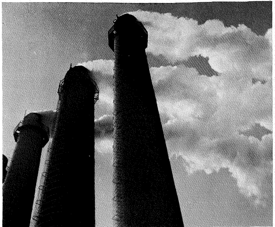
Die Hochschornsteinpolitik hat die Probleme der Luft nur verlagert. Was die Bundesrepublik Deutschland „wegbläst“, erhält sie von den Nachbarn zurück

Wer die Qualität der Luftreinhaltepolitik überwiegend nach Umfang der immissionsschutzrechtlichen Regelungen und den administrativen Vollzugsaufwand beurteilt, kommt leicht zu dem Ergebnis, daß die Bundesrepublik Deutschland im internationalen Vergleich die „Nase vorn hat“. Zu einer abweichenden Schlußfolgerung kommt eine Untersuchung des Umweltinstituts im Wissenschaftszentrum Berlin, in der insbesondere nach den Effekten der Immissionsschutzpolitik in Relation zum behördlichen Aufwand gefragt wurde. Der Politikwissenschaftler Helmut Weidner stellt einige zentrale Ergebnisse der von der Stiftung Volkswagenwerk und der Deutschen Forschungsgemeinschaft geförderten Studien zur Normbildung und Implementation in der SO 2 -Luftreinhaltepolitik vor.