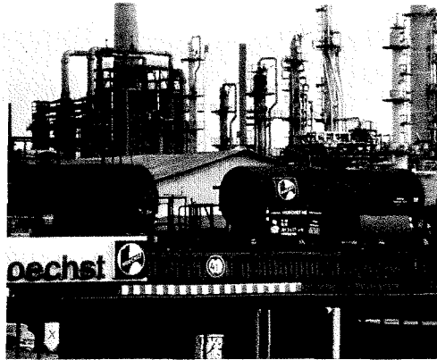
HOECHST IN FRANKFURT