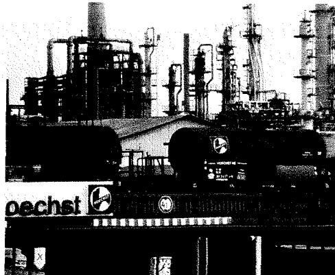
HOECHST IN FRANKFURT