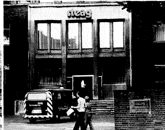
STEAG IN ESSEN