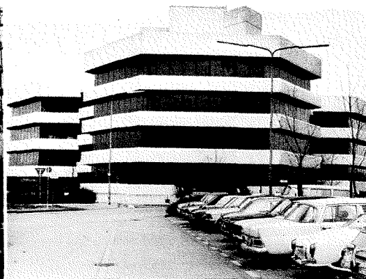
RANK XEROX IN DÜSSELDORF