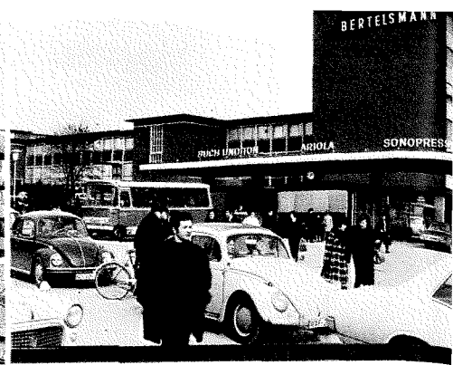
BERTELSMANN IN GÜTERSLOH