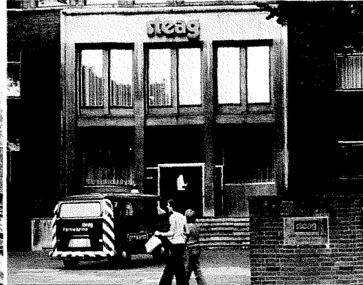
STEAG IN ESSEN