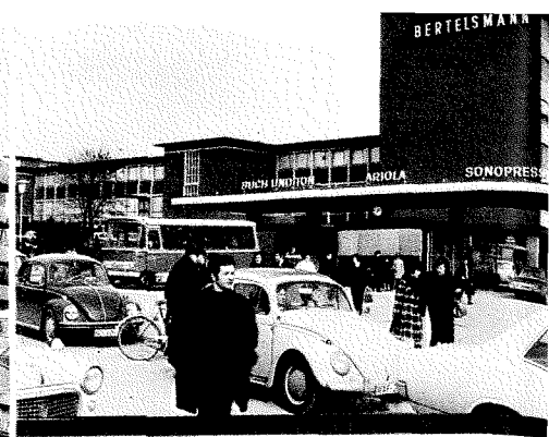
BERTELSMANN IN GÜTERSLOH