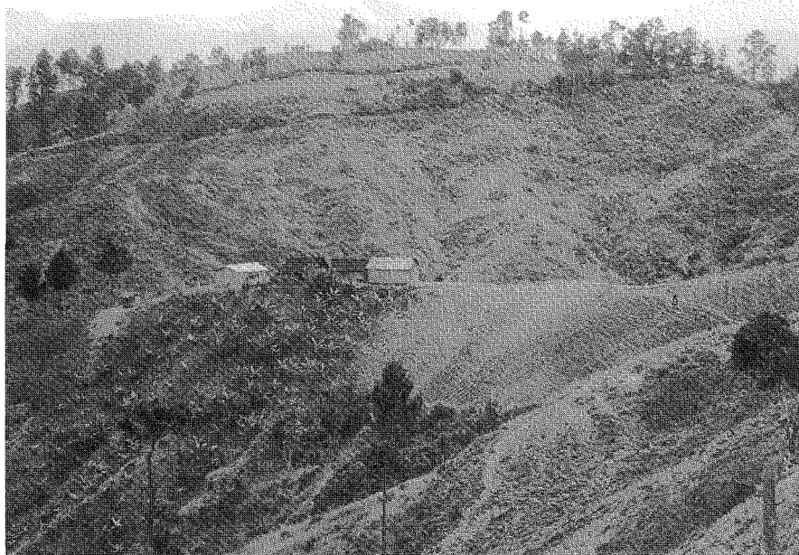
Kleinbauern, die aus der Ebene vertrieben wurden, nutzen nun die Berghänge landwirtschaftlich

Die Durchführung von Umweltverträglichkeitsprüfungen erfordert natürlich personelle und finanzielle Ressourcen. In vielen Ländern mangelt es an solchen Ressourcen. In manchen Fällen wurde das Potential dieser Methode auch nicht voll verstanden. Die „Umweltver-