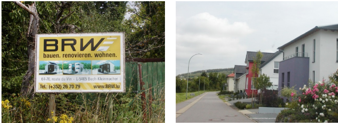
Abb. 3: Werbung einer luxemburgischen Baugesellschaft und ein Neubaugebiet in der Gemeinde Perl

werden die Häuser nahezu vollständig zu Wohnzwecken genutzt. Lediglich in Einzelfällen umfasst die Hausnutzung neben dem Bereich „Wohnen“ zusätzlich noch gewerbliche Zwecke.